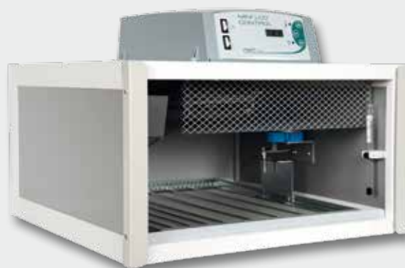
Caratteristiche MINI LCD vedere pagina 6 MINI LCD Features see page 6