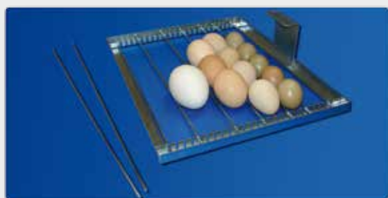
Griglia volta uova ad inserti regolabili Adjustable egg turning grid

These models in "New Generation" range, in spite of reduced dimensions, are characterized by the robustness, thanks to stratified materials with laminate finishing. These elements, associated with top performance of both models, allowed us to reach a high level of diffusion and appreciation in domestic and foreign markets.