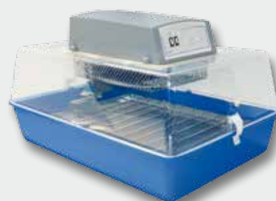
Versione analogica Analog version